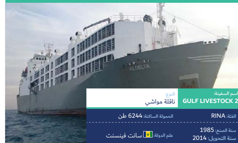
اسم السفينة: GULF LIVESTOCK 2

النوع: ناقلة مواشي الدفعة: RINA سنة الصنع: 1985 سنة التحويل: 2014 علم الدولة: سانت فينسنت