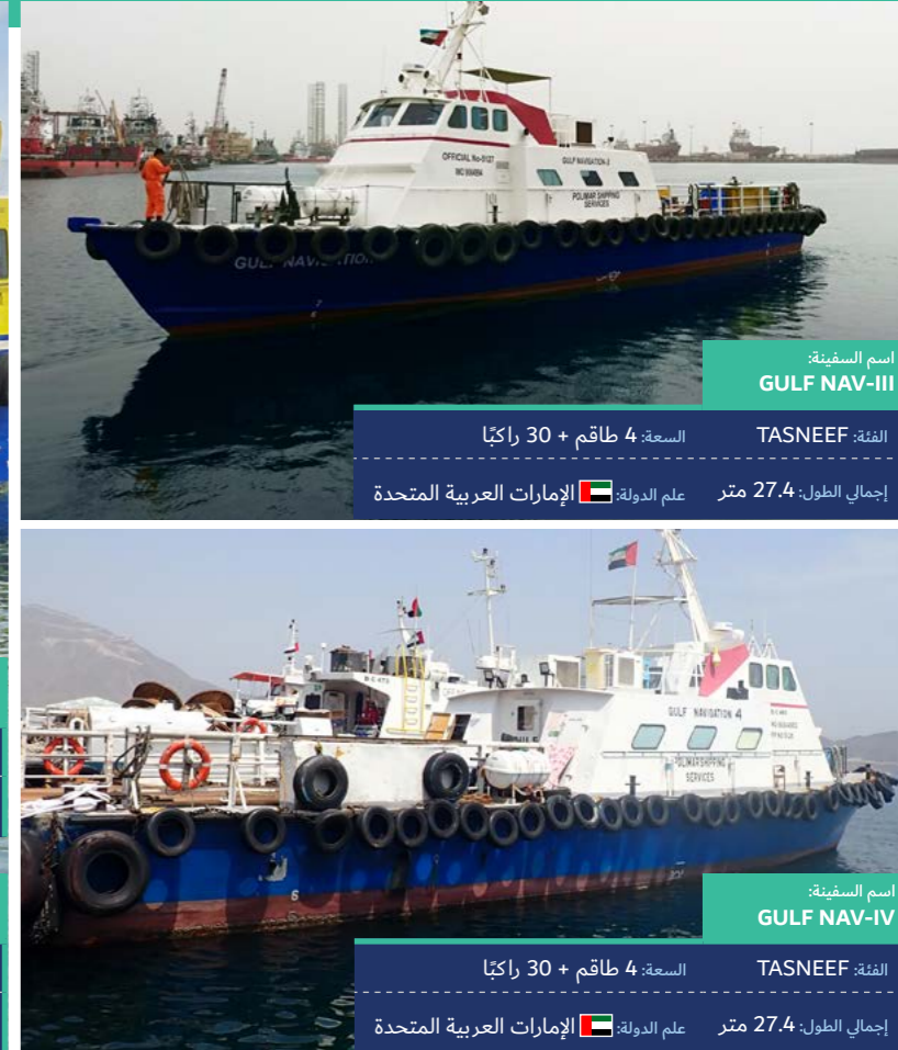
اسم السفينة: GULF NAV-III

الدفعة: BV السعة: 4 طاقم + 39 راكباً إجمالي الطول: 23.7 متر علم الدولة: الإمارات العربية المتحدة