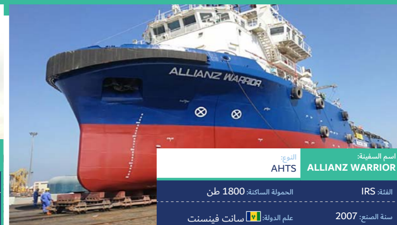
اسم السفينة: ALLIANZ WARRIOR

النوع: AHTS الدفعة: IRS سنة الصنع: 2007 علم الدولة: سانت فينسنت